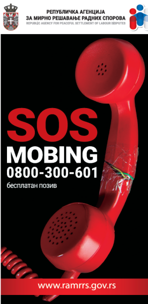
Промотивни летак Агенције за афирмацију „SOS MOBING“ телефонске линије

РЕПУБЛИЧКА АГЕНЦИЈА ЗА МИРНО РЕШАВАЊЕ РАДНИХ СПОРОВА REPUBLIC AGENCY FOR PEACEFUL SETTLEMENT OF LABOUR DISPUTES Адреса: Македонска бр. 4, 11000 Београд Телефон/факс: 011/3131-416; 011/3131-418; Електронска пошта: kabinet@ramrrs.gov.rs