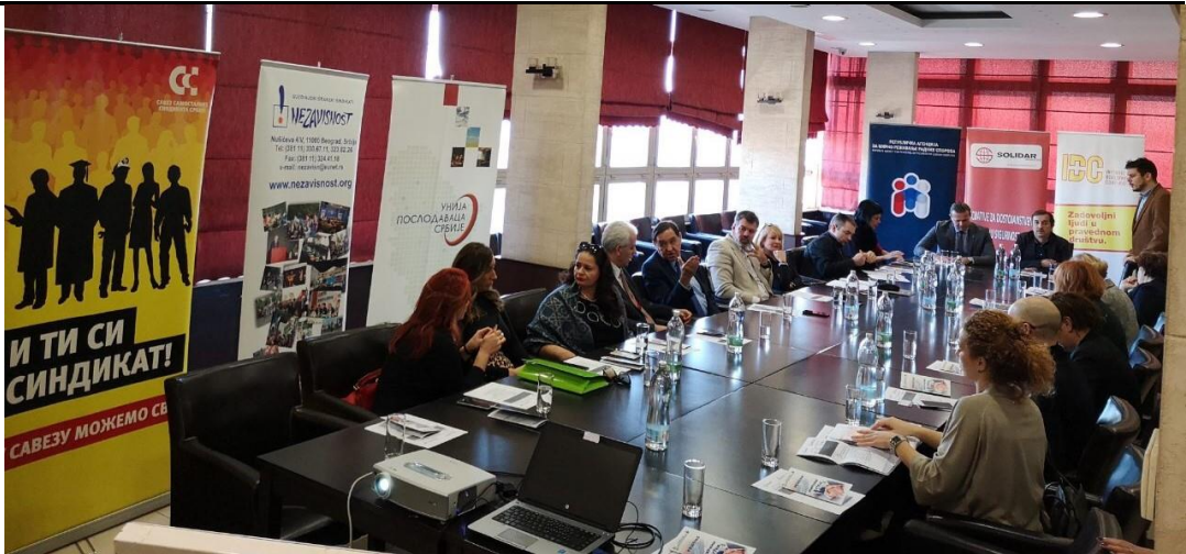
Конференција у Београду

Републичка агенција за мирно решавање радних спорова тренутно има укупно 54 миритеља и арбитра, а од тог броја 12 оних који су само миритељи и високо специјализовани су за колективне спорове, а има укупно 41-ог арбитра специјализованих за све индивидуалне радне спорове. Од укупног броја миритеља и арбитра у 2018. години, ангажовано је 43 миритеља и арбитра, од чега 11 миритеља и 33 арбитра. У 5 спорова је постигнута сагласност око избора миритеља и арбитра, док је у осталим избор био препуштен директору, што чини мало више од 10% случајева када је миритељ и арбитар изабран уз сагласност воља страна.