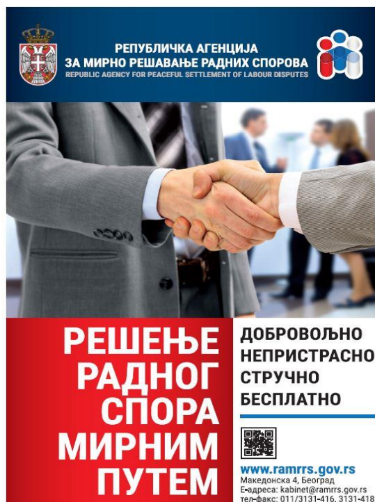
Промотивни плакат Агенције

У циљу повећања видљивости Агенције, поред медијских објава, гостовања и текстова за штампу, Републичка агенција за мирно решавање радних спорова је припремила промотивне плакате и летке које је дистрибуирала свим социјалним партнерима у циљу приближавања надлежности из свог делокруга, четврту годину за редом. Израду овог материјала и пратећих садржаја, календара, летака и др. помагали су финансијски и Међународна организација рада (МОП) и Удружење грађана „ИДЦ“.