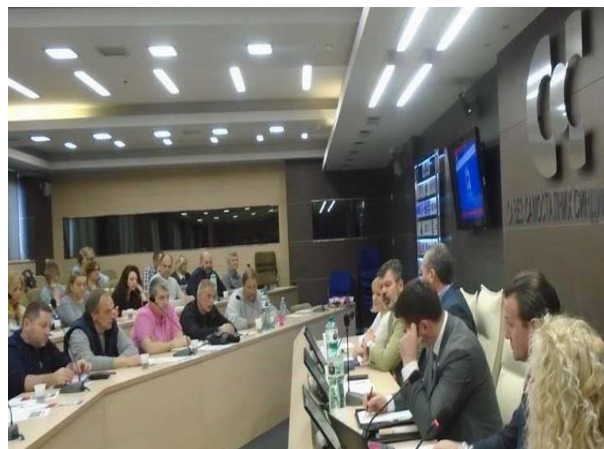
Синдикални скупови у Београду

На основу Меморандума о разумевању који је потписан са УГ Иницијатива за развој и сарадњу, у партнерству са социјалним партнерима: Савезом самосталних синдиката Србије, Уједињеним гранским синдикатом „Независност“, Унијом послодаваца Србије и уз финансијску подршку Solidar Suisse/Swiss Labour Assistance (SLA) - Канцеларија у Србији, Агенција је учествовала у процесу имплементације активности у оквиру пројекта „Социјални партнери заједно за повећање видљивости института мирног решавања радних спорова“.