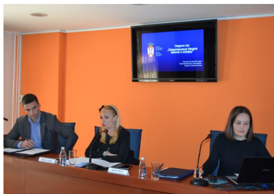
Јавна расправа у Новом Саду