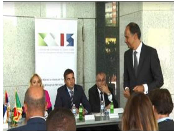
Састанак у Комори

Агенција се одазвала на позив Савеза самосталних синдиката Београда и одржала Округли сто 30. марта 2018. године у циљу упознавања синдикалног руководства са институтом мирног решавања радних спорова. Такође, на позив свих Одбора Комуналних предузећа града Београда Самосталног синдиката 16. маја 2018. године презентован је рад Агенције начини за помоћ запосленима који имају спор са послодавцем и локалним самоуправама и другим питањима из области радног права.