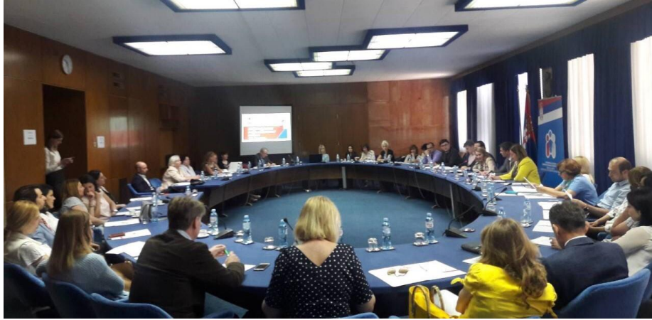
Први интерактивни семинар

Нацрту Закона о штрајку и разговарало се о поступцима у раду у циљу уједначавања праксе и смањења неизвесности грађана у поступцима мирног решавања радних спорова пред Агенцијом.