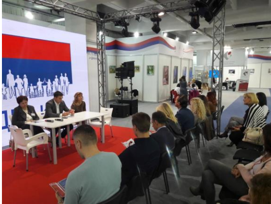
Округли сто „SOS Mobing“