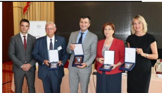
Субрегионална конференција МОР-а у Аранђеловцу