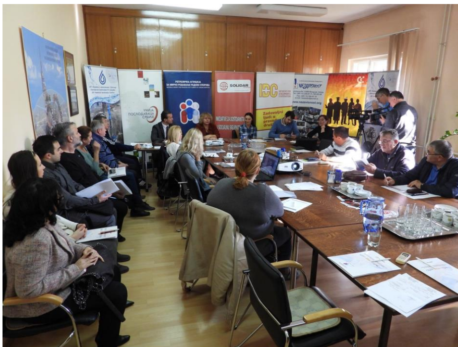
Радионица у Суботици

спорова, организоване су и две посебне презентације за послодавце, 21. новембра у Крушевцу и 28. новембра 2018. године у Новом Саду. Послодавцима је представљен „ On line “ курс за послодавце о поступку мирног решавања радних спорова, а који је постављен на линку: www.mrrs.rs . Циљ овог курса је да се кроз кратку видео презентацију посебно послодавци упознају са предностима мирног решавања радних спорова, али и сви заинтересовани. Након одгледане презентације сви заинтересовани су могли да ураде и кратак „On line“ тест свог познавања области. Послодавцима је представљена и апликација за мобилне телефоне о мирном решавању радних спорова, која олакшава размену информација за све заинтересоване за мирно решавање радних спорова, кроз могућност постављања питања и покретања поступка путем мобилног телефона, али и за миритеље и арбитре кроз стручни форум у циљу уједначења праксе.