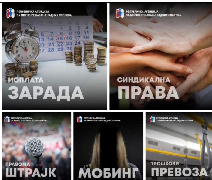
Интернет објаве Агенције

Агенција је наставила рад на модернизацији и јачању информатичко-техничких капацитета. Интернет презентација Агенције на домену: www.ramrrs.gov.rs , која је усклађена са савременим техничким захтевима, редовно је ажурирана и развијена је њена интерактивност у погледу праћења тока поступка од стране учесника у поступку, а у складу са Смерницама Владе Републике Србије за израду веб презентација органа државне управе. Интерактивност презентације је усмерена ка лакшем информисању свих заинтересованих о поступцима пред Агенцијом, на праћење статуса покренутих поступака, пружању правне помоћи, путем веб сајта, процес комуникације је поједностављен и убрзан.