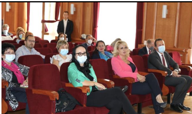
Научно саветовање Удружења за радно право