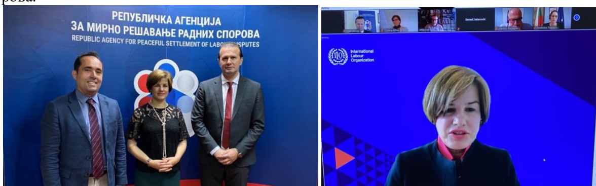
Посета и онлајн састанак регионалне мреже агенција за мирно решавање радних спорова