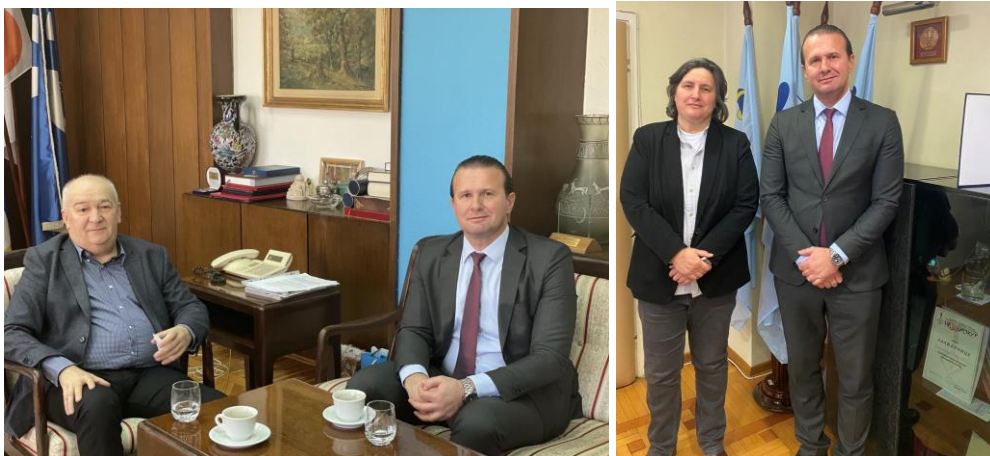
Посета СССС и УГС „Независност“

Републичка агенција за мирно решавање радних спорова је током 2021. године организовала посете синдикалним централама репрезентативних синдиката Савеза самосталних синдиката Србије (СССС) и УГС „Независност“, као и синдикалним централама које нису репрезентативне али су веће - Конфедерацији слободних синдиката (КСС), Асоцијацији слободних и независних синдиката (АСНС) и Удруженим синдикатима Србије „Слога“, а све у циљу унапређења сарадње и разговора о даљим активностима. Током ових посета разговарало се о промоцији института мирног решавања радних спорова међу синдикалним члановима који су корисници услуга Агенције и анализирана су досадашња искуства и сарадња. Разматране су могућности за унапређење и интензивирање сарадње и специјализованих едукација за синдикално чланство. Договорена је и дистрибуција промотивних материјала Агенције међу синдикалним чланством како би се упознали са могућностима које имају у погледу заштите права пред Агенцијом.