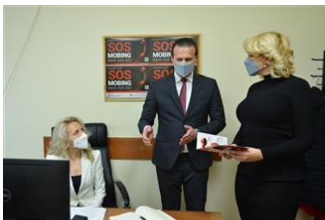
Представљање резултата петогодишњег рада пројекта СОС мобинг телефона