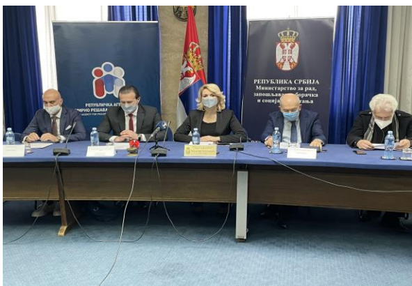
Прва интерактивна обука