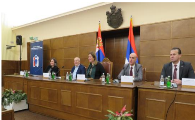
Друга интерактивна обука